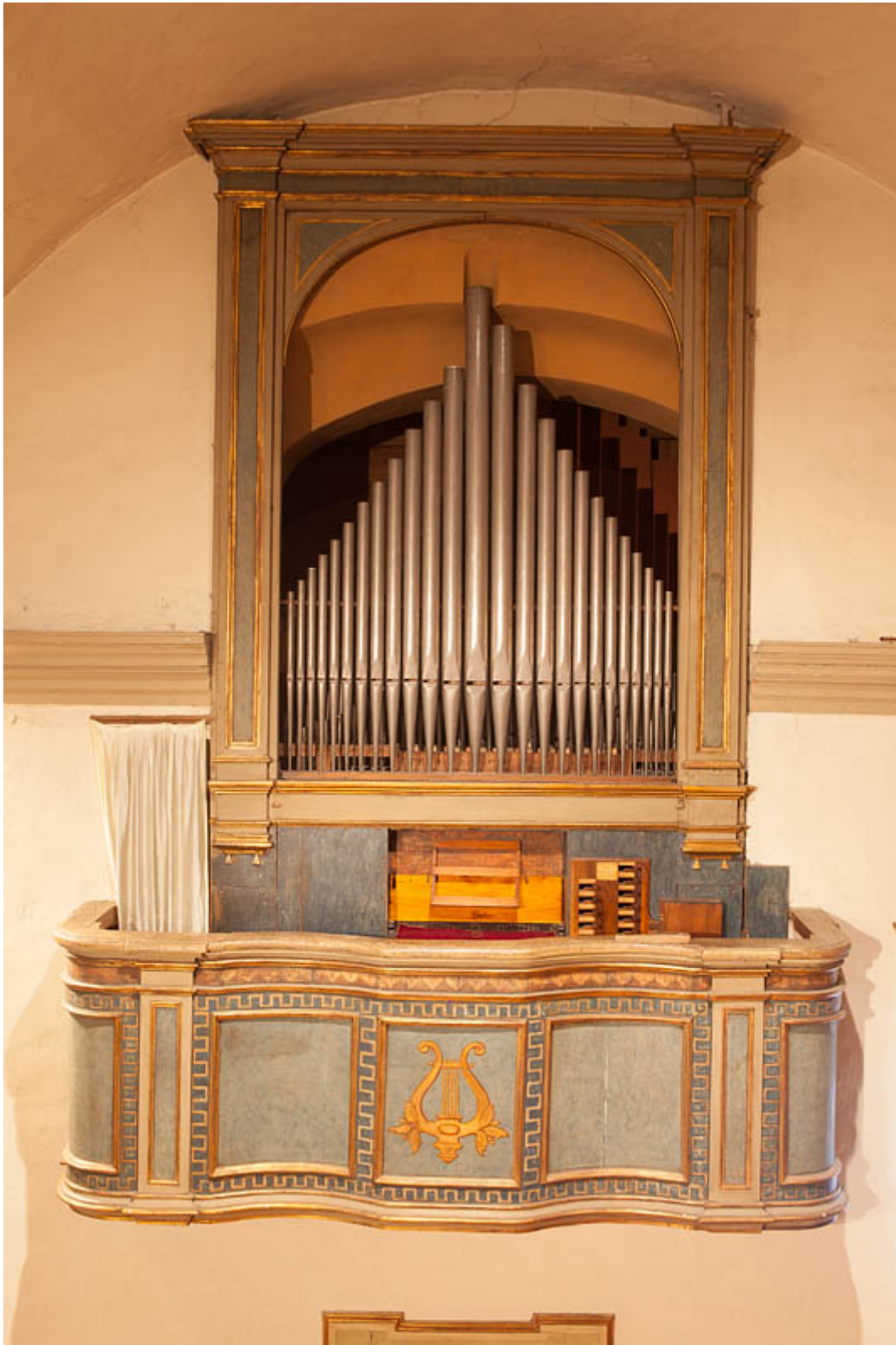
Francesco Bossi, Organo della Chiesa di San Michele Arcangelo a Roncole di Busseto, 1797