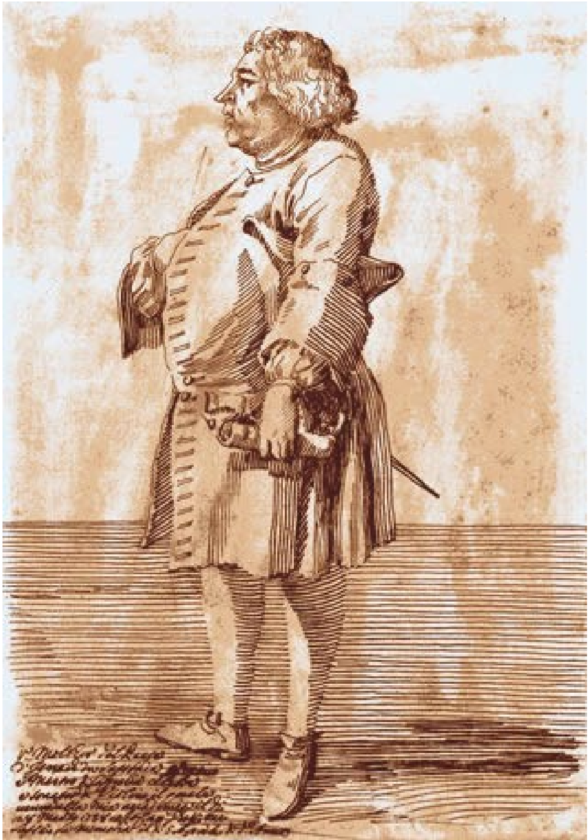
Johann Melchior Molter (1696 – 1765)