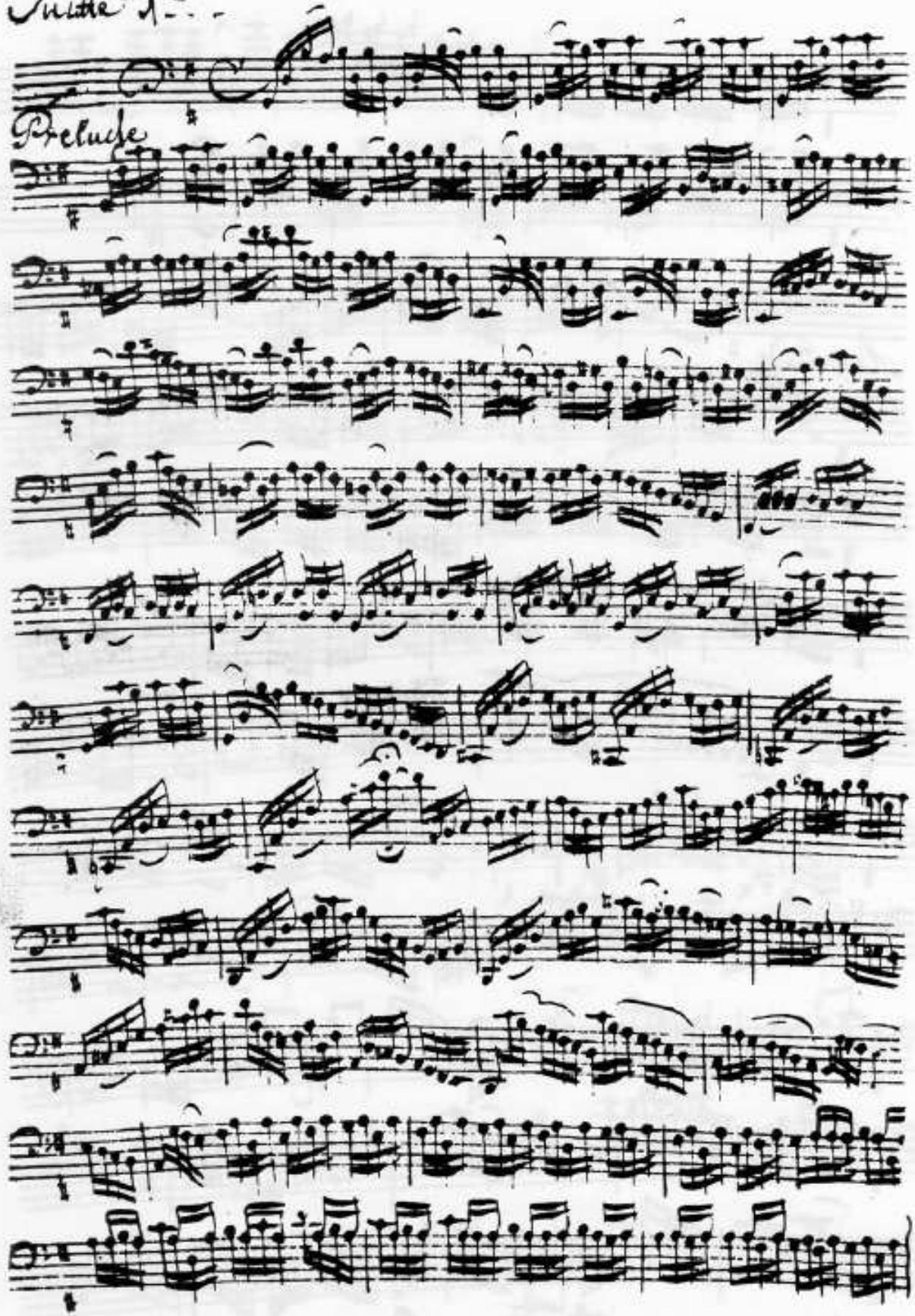
Johann Sebastian Bach, Suite n. 1 BWV 1007 Staatsbibliothek zu Berlin, Preußischer Kulturbesitz. D-B Mus. ms. Bach P 269 (copia di Anna Magdalena Bach)